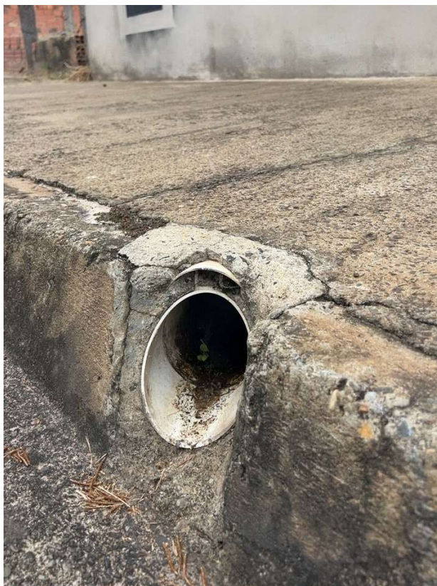
Figura 10. Imóvel identificado com lançamento irregular na rede coletora de esgoto - Rua Silvio Trevisane, s/n em frente ao Projeto Social, 389.

Os testes consistiram na introdução de fumaça inofensiva nas tubulações, caracterizando-se como um procedimento seguro, atóxico e temporário, sem riscos à saúde pública ou ao meio ambiente. Durante a execução dos serviços, a equipe da SABESP estava devidamente identificada, atuando conforme os protocolos técnicos e operacionais vigentes.