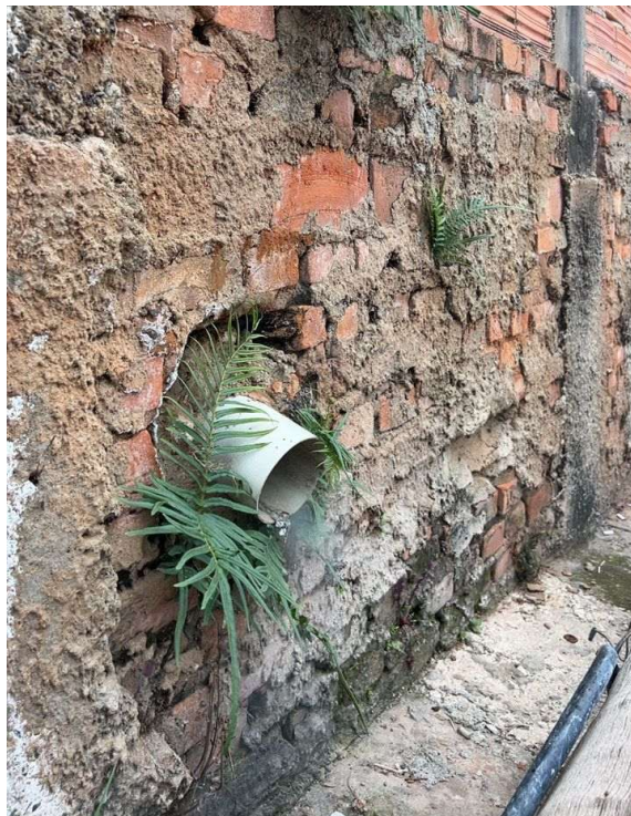
Figura 8. Imóvel identificado com lançamento irregular na rede coletora de esgoto - Rua Silvio Trevisane, 366.