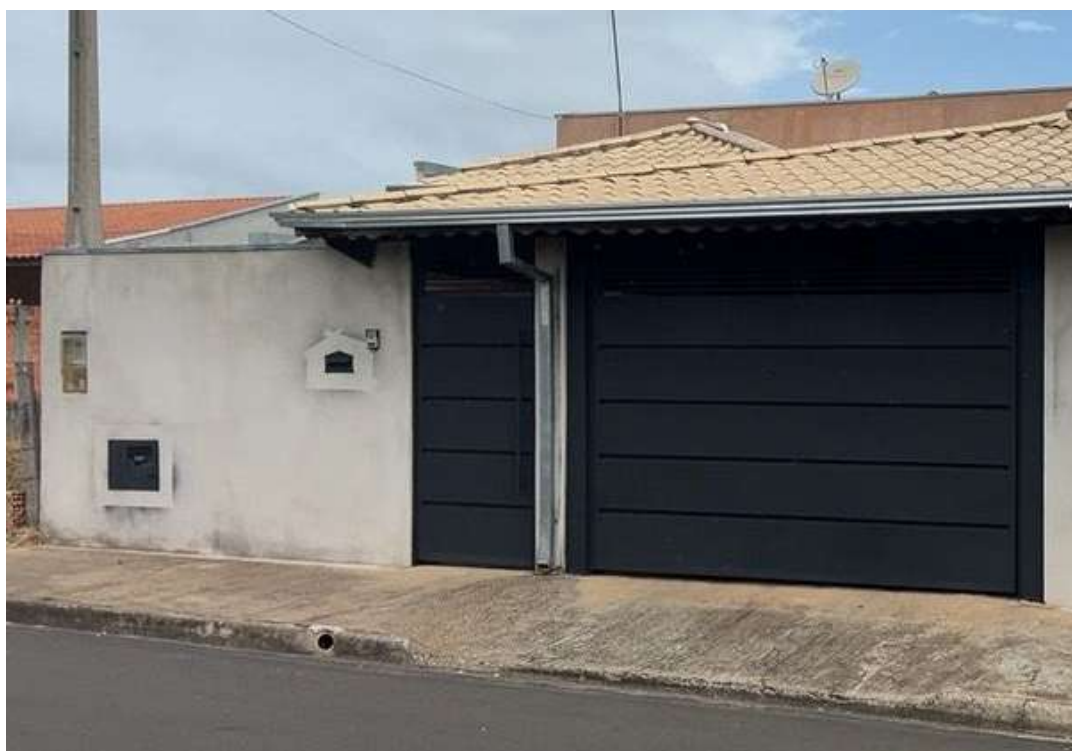
Figura 9. Imóvel identificado com lançamento irregular na rede coletora de esgoto - Rua Silvio Trevisane, s/n em frente ao Projeto Social, 389.