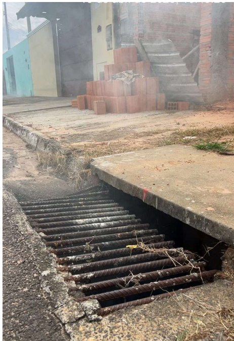
Figura 2. Presença de fumaça na galeria de águas pluviais.