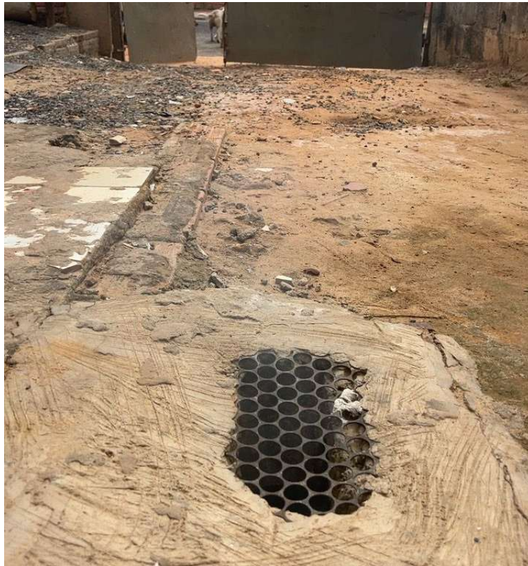
Figura 6. Imóvel identificado com lançamento irregular na rede coletora de esgoto - Avenida Botucatu, 386.