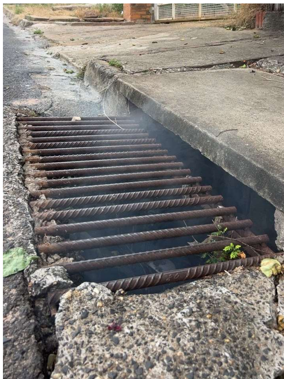
Figura 1. Presença de fumaça na galeria de águas pluviais.

Os testes resultaram na identificação de fumaça em galerias de águas pluviais próximo aos números mencionados no ofício, bem como nas saídas de águas pluviais de alguns imóveis da região, conforme figuras a seguir.