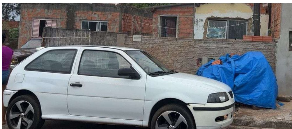
Figura 5. Imóvel identificado com lançamento irregular na rede coletora de esgoto - Avenida Botucatu, 386.