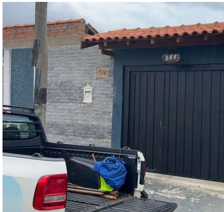
Figura 7. Imóvel identificado com lançamento irregular na rede coletora de esgoto - Rua Silvio Trevisane, 366