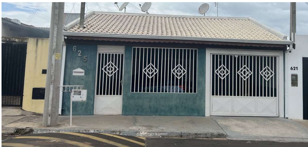
Figura 3. Imóvel identificado com lançamento irregular na rede coletora de esgoto - Avenida Rubião Junior, 625.