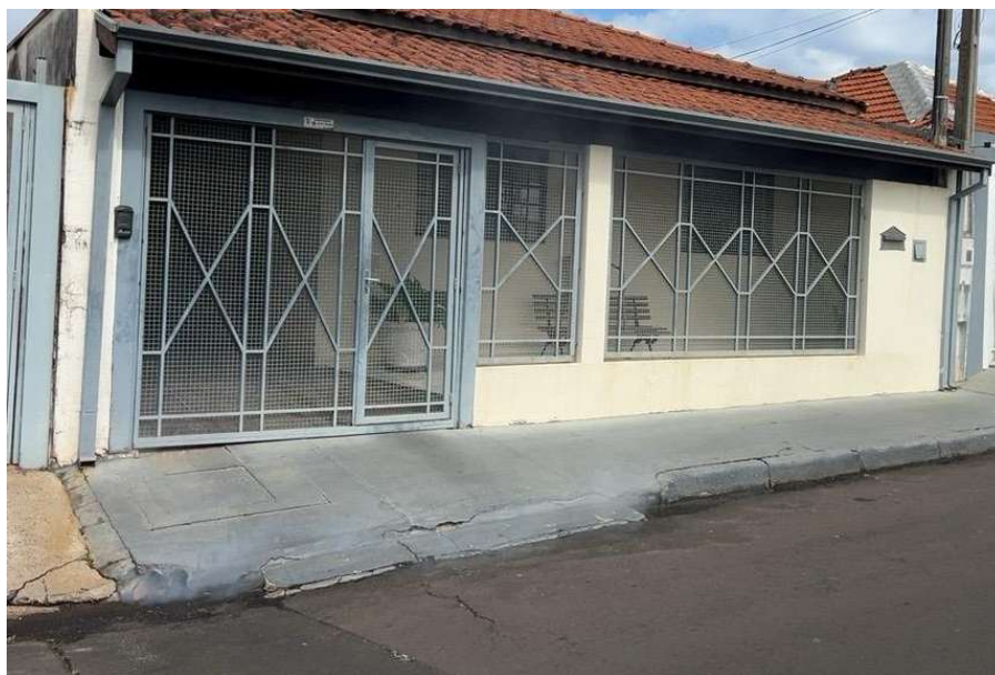
Figura 4. Irregularidade identificada na Rua Darcilio Pinheiro Machado, nº 115.

Os testes consistiram na introdução de fumaça inofensiva nas tubulações, caracterizando-se como um procedimento seguro, atóxico e temporário, sem riscos à saúde pública ou ao meio ambiente.