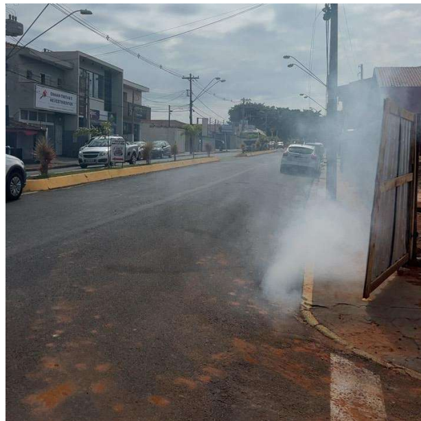
Figura 3. Teste de fumaça realizado em Poço de Visita (PV) e galeria com presença de fumaça na Avenida Camilo Mazzoni, próximo Avenida Camilo Mazzoni com a Rua Darcílio Pinheiro Machado.