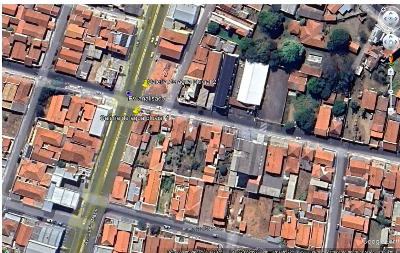
Figura 1. Teste de fumaça realizado em Poço de Visita (PV) e galerias que apresentaram presença de fumaça, próximo ao Cruzamento da Avenida Camilo Mazzoni com Rua Darcilio Pinheiro Machado.

Os testes resultaram na identificação de fumaça em duas galerias de águas pluviais próximo ao número mencionado no ofício, bem como na saída de águas pluviais em um imóvel próximo ao local dos testes, conforme figuras a seguir.