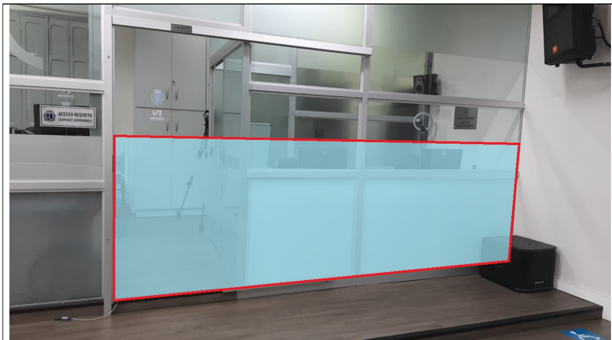
Demonstrativo gráfico aproximado da área a ser aplicado o adesivo jateado.