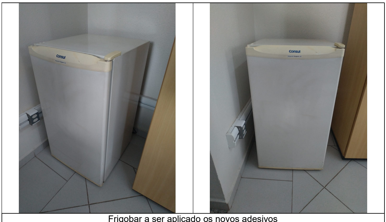
Frigobar a ser aplicado os novos adesivos

4.6.5. Segue abaixo imagem ilustrativa do frigobar a ser aplicado os novos adesivos: