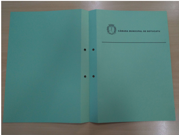
Exemplo 2 - Frente Aberto